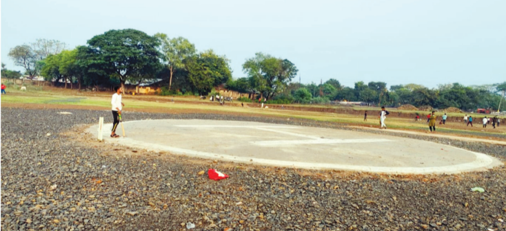
स्वतंत्र समय, बरेली

स्टेडियम निर्माण की घोषणा हुए बीत गए 11 वर्ष, फिर भी समस्या जस की तस